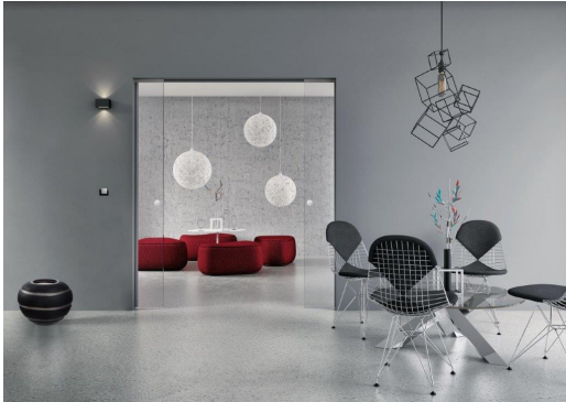
wb_B2K_G_klar: Zweiflüglige Glastüren lassen den Raum auch im geschlossenen Zustand großzügig und offen wirken.