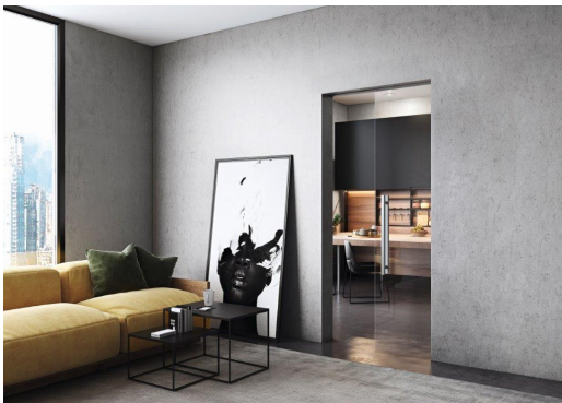
wb_B1_G_beton: Eleganter Raumteiler: Die zargenlose Schiebetür aus Glas separiert Wohn- und Essbereich voneinander.